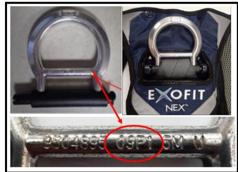
Paso 1: Fecha de fabricación en el arnés mostrada en el círculo rojo – debe ser entre 16/01 (enero de 2016) y 18/12 (diciembre de 2018)