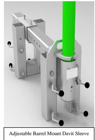
Adjustable Barrel Mount Davit Sleeve

End-users: If you have an affected unit, please contact Customer Service at 800-328-6146 (prompt #2012) or email 3MUSFPServiceAction@mmm.com to receive your Retrofit Kit free of charge. Retrofit Kit P/N 8547945. If you provide us with your contact information, shipping address, and part/model details of the product you have, we will send you the Retrofit Kit free of charge. When you receive the Retrofit, please locate the updated IFU, which can be found at http://capitalsafety.webdamdb.com/viewphoto.php?&albumId=562594&imageId=15807097