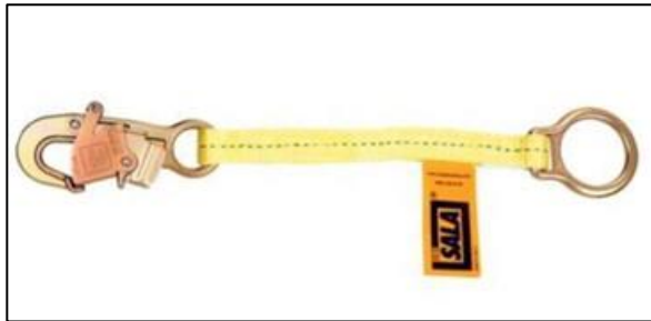
3M ID 70007438503/3M DBI-SALA® PN 123117

La línea de productos de Protección contra Caídas de 3M ha recibido una serie de consultas respecto al uso de los extensores de anillo D dorsal con anticaídas autorretráctil (Self-Retracting Lanyard, SRL) de bordes frontales en entornos donde hay bordes filosos. A continuación presentamos dos ejemplos de extensores de anillo D dorsal de la línea 3M; pero el asunto abarca a todos los extensores de anillo D dorsal, independientemente de su distribuidor/fabricante: